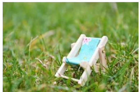
N. Schwarz © GemeindebriefDruckerei.de