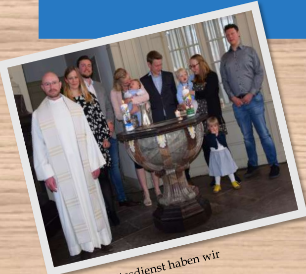
Im Ostergottesdienst haben wir