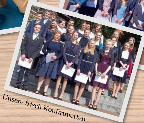
Unsere frisch Konfirmierten