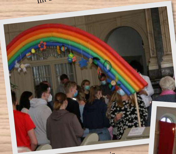
An Ostermontag feierten wir Familiengottesdienst