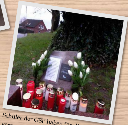
Schüler der GSP haben für die vergessenen Opfer des 2. Weltkrieges eine Gedenktafel gefertigt